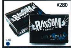
Bright white color and coconut scent. Ransom uses an aggressive bump building formula that will out perform all others.