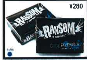
Bright white color and coconut scent. Ransom uses an aggressive bump building formula that will out perform all others.