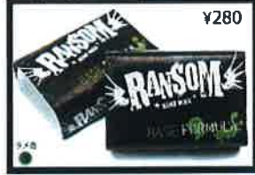
Bright white color and coconut scent. Base is the back bone of your wax job. Use! I was up a new board with out it.