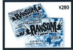
For elite performance athletes, this softer ultra grippy formula works in cool/cold waters.

Temp Range: 65°F/20C & below GOOEY COOL/COLD