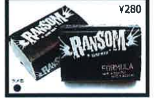
This is the softest tackiest formula for those cold waters. White in color and fresh coconut scent.