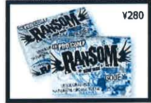
For elite performance athletes, this softer ultra grippy formula works in cool/cold waters.

Temp Range: 65°F/20C & below GOOEY COOL/COLD