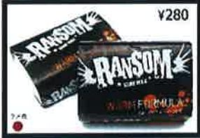
Bright white color and coconut scent. Formula builds huge bumps that are stickier and last longer than other formulas.