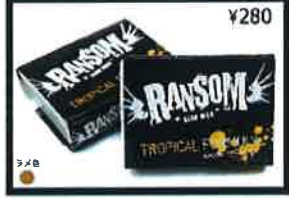
A harder wax with lighter bump structure to stand up to the warmer climates. White in color with that fresh coconut scent you love.