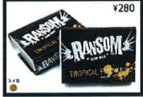
A harder wax with lighter bump structure to stand up to the warmer climates. White in color with that fresh coconut scent you love.