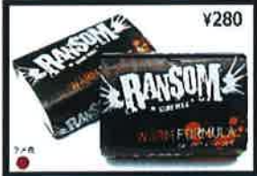
Bright white color and coconut scent. Formula builds huge bumps that are stickier and last longer than other formulas.