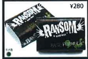
Bright white color and coconut scent. Base is the back bone of your wax job, don't mess up a new board with out it.