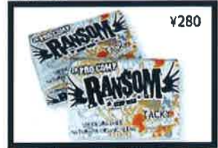
For elite performance athletes, this harder ultra grippy formula works in warm/tropical waters.

Temp Range: 70°F/21C & above TACKY WARM/TROP